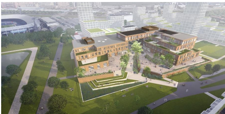
Nieuw schoolgebouw wordt geopend in 2026

Heb je een vraag? Neem contact op met je coach, docent, zorgcoördinator, teamleider of locatiedirecteur! Of stuur een mail naar info@moverotterdam.nl